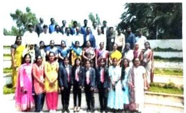
Group Photo with Guests and Delegates