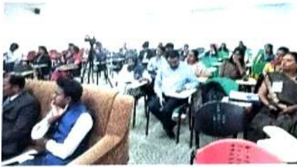
Involvement of Delegates