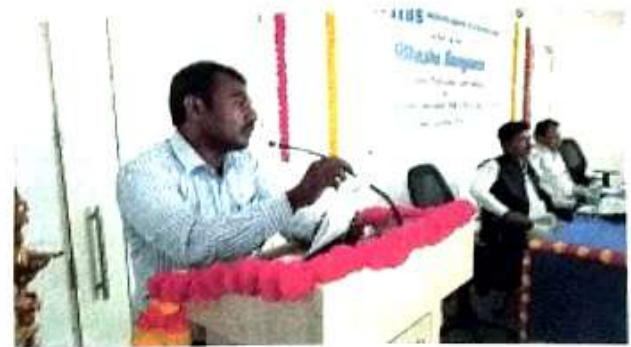
Paper Presentation by Delegates